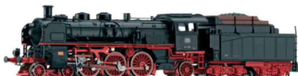
Abbildung zeigt Vorserienmuster

Schnellzugdampflokomotive der Baureihe 18.5 der DB, Modell mit verbessertem Antrieb