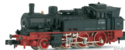
Abbildung zeigt Vorserienmuster

Leichte Tenderlok der Baureihe 74 4-13 der DB, ehem. preußische T12, neue Betriebsnummer