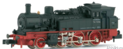
Abbildung zeigt Vorserienmuster

Leichte Tenderlok der Baureihe 74 4-13 der DR, ehem. preußische T12, neue Betriebsnummer